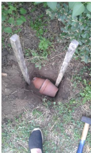
Mise en terre

Cette préparation s'élabore durant la période fin de printemps, début d'été. Les tiges récoltées ne doivent pas avoir commencé leur floraison, sous peine de retrouver des graines qui risqueraient de germer dans la préparation finale, et de baisser la qualité de celle-ci.