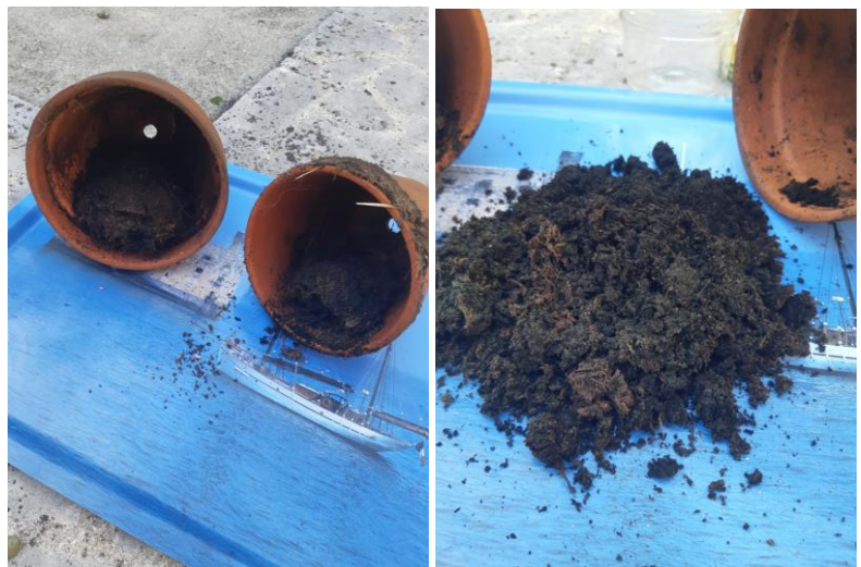
Préparation finale au bout d'un an

Les feuilles et tiges d'orties sont incorporées dans un boisseau ou comme dans l'exemple suivant dans deux pots de jardinage, l'ouverture de l'un insérée dans celle du deuxième. L'ensemble est enterré pour une durée d'un an.