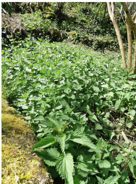
Pissenlit au bon stade de récolte

Vous savez certainement que la récolte des tiges d'Ortie ( Urtica dioica ), peut se réaliser tôt en saison, dès début avril, notamment pour élaborer la délicieuse soupe du même nom.