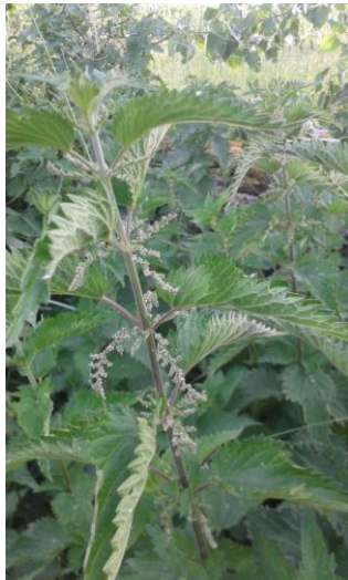
Ortie avant floraison