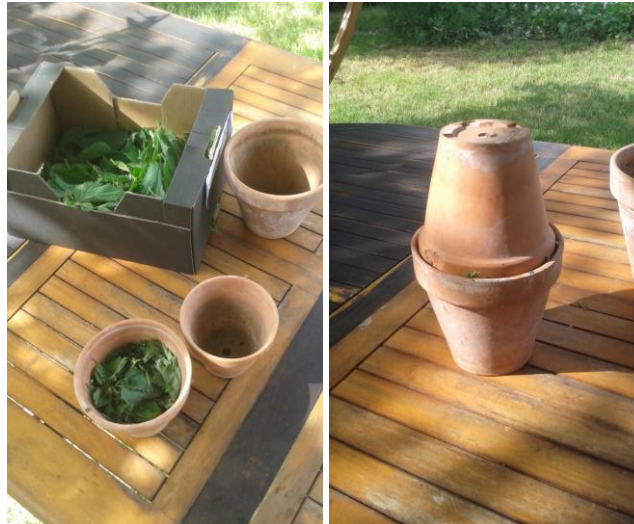
Remplissage et fermeture des pots

Cette préparation s'élabore durant la période fin de printemps, début d'été. Les tiges récoltées ne doivent pas avoir commencé leur floraison, sous peine de retrouver des graines qui risqueraient de germer dans la préparation finale, et de baisser la qualité de celle-ci.