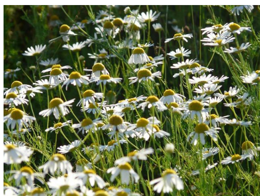
Fleurs de Camomille Matricaire

Cette tisane va avoir un effet adoucissant et va stimuler la circulation de la sève au sein de l'ensemble de la plante, dans des situations de stress hydrique et de sécheresse. Conditions prévues pour les dix prochains jours !