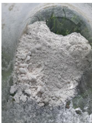
Silice de Corne

Cette préparation, qui est élaborée à partir de poudre de quartz et de corne de vache, favorise une bonne relation de la vigne avec les forces cosmiques.