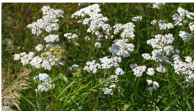
Fleurs d'Achillée Millefeuille