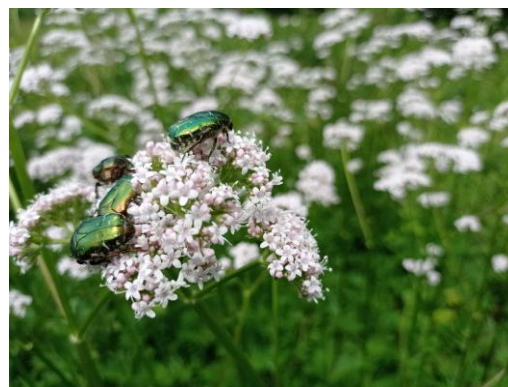
Fleurs de Valériane