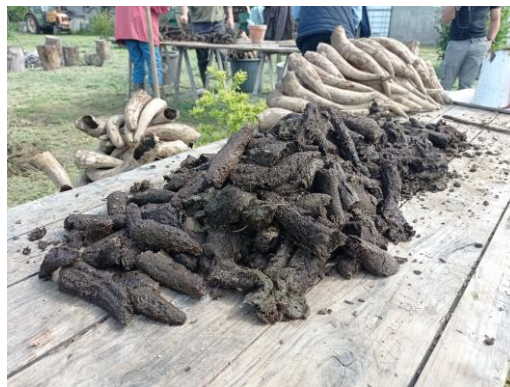
Bouse de Corne