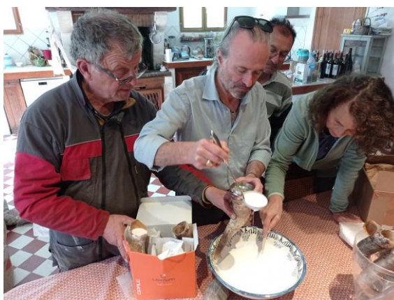
Elaboration de la préparation

En ce milieu d'été, durant tout le mois d'août et début septembre, cette préparation va permettre de réduire l'élan de croissance végétative de vos vignes et d'accompagner celle-ci dans le processus de véraison, tout au long du grossissement des baies et dans l'accumulation des sucres, des arômes et de tous les polyphénols, constituants de vos baies de raisins.