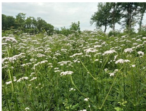
Pieds de Valériane

Suite aux températures chaudes des dernières semaines, et celles prévues pour les prochaines, tout au long du mois d'août, il est recommandé de réaliser un passage avec la préparation Valériane (507), afin d'accompagner vos pieds de vigne après cette période « stressante ».