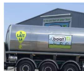
Des fermes engagées dans une Démarche Qualité : troupeaux de taille modeste, allongement des périodes de pâturage extérieur, lait riche en oméga 3, aménagements pour le maintien de la biodiversité, limitation de l'empreinte carbone...

Biolait a développé la marque " IL LAIT LA ", repérable sur les produits vendus dans les ferme et auprès de grands distributeurs.