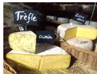
Panel de tommes jeunes ou affinées, nature ou assaisonnées : cumin, fenugrec, trèfle, ortie-ail, moutarde, poivre

La transformation à la ferme constitue une valeur ajoutée , permettant aux éleveurs que la vente directe représente 45% de leur chiffre d'affaire en 2024.