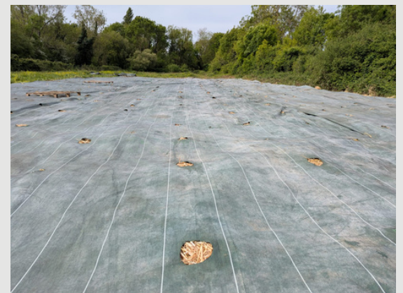
Toile tissée prétrouée