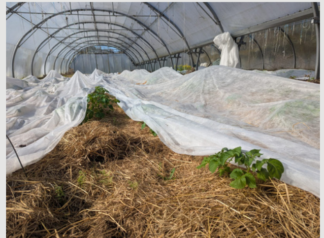
Serre de pomme de terre primeur