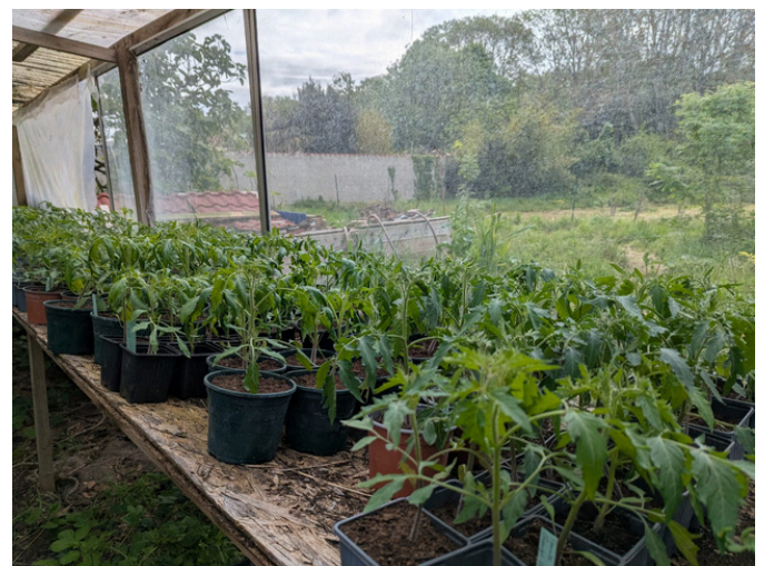
Serre de plants destinés à sa production et à la vente aux particuliers