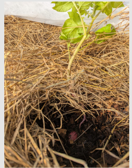
Pomme de terre primeur sous paille