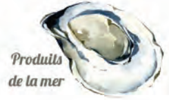
Produits de la mer