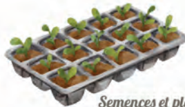
Semences et plants