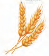
Céréales, farines, huiles