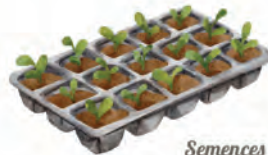
Semences et plants